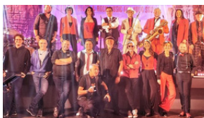
Soul Band "UTAH"

PAF : 18€ - Prévente 15€ - Réduit 12€ - Enfants moins de 12 ans 5€