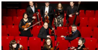
Ensemble "Les Virtuoses"

Mardi 23 juillet 2024 Eglise Notre-Dame de l'Assomption 21h00