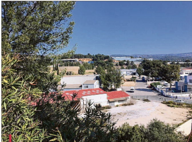
Rues désertes et silence inhabituel, depuis quelques jours, dans les zones Athélia. Mais l'équipe d'Athélia entreprendre reste en veille.

Dans un premier temps, la structure s'impose comme un relais d'informations important. Chaque matin (ou après-midi), les entreprises adhérentes reçoivent un "flash info" par mail. "Il y a un volet pratique, afin de faciliter les démarches. Nous communiquons de l'info service, comme les liens avec La Poste, des solutions Ursaf, des questions sur le chômage partiel... Nous faisons